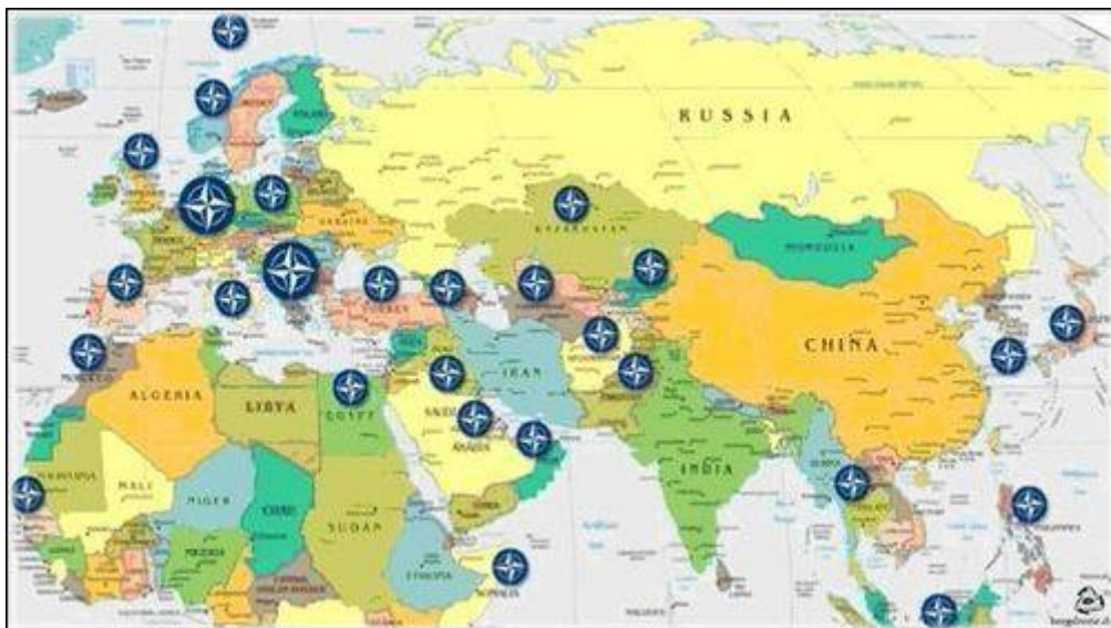
Obr. 3 Vojenské základny NATO v Evropě a Asii

Když analyzujeme trendy vývoje a deklarované pozice jednotlivých států a uskupení, pak je jasně patrný územní rozmach států NATO a rozšiřování vojenských základen po celém světě. To svědčí o tom, že tyto základny nemají být použity pro obranu území členských států NATO, ale zejména pro obsazení a udržení cizích území, především v zájmu USA. Důležitá je vedoucí role USA v celém svazku NATO, které se ostatní státy víceméně dobrovolně podřizují . Již v roce 2005 měly USA po světě 737 základen a dnes se jejich počet výrazně navýšil. Na summitu NATO v Tallinu bylo rozhodnuto o vybudování dalších základen zejména v pobaltských státech a Gruzii (viz obr. 3). Rusko na tento vývoj zareagovalo plánem rozmístění nových základen ve spojeneckých státech – ve Vietnamu, na Kubě, ve Venezuele, Nikaragui a na Seychelských ostrovech. Proč asi Rusko odpustilo Kubě 90% dluhu z dob studené války?