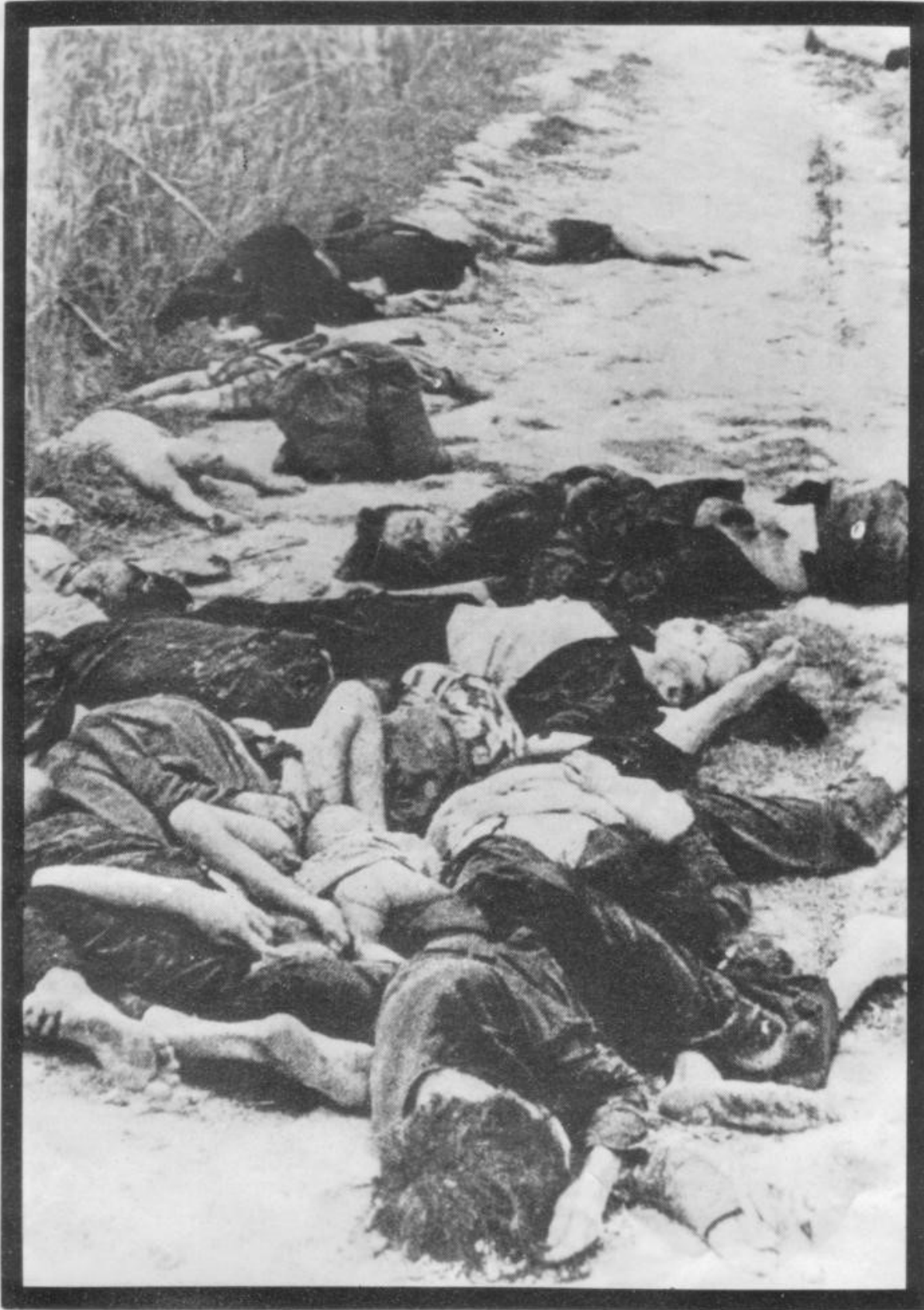
U S mass killing - Massacre at Sơn Mỹ (My Lai) on March 16, 1968 where 504 peoples were killed.