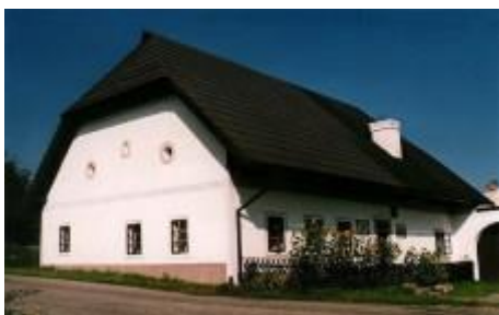
Rodný dům Adalberta Stiftera v Horní Plané