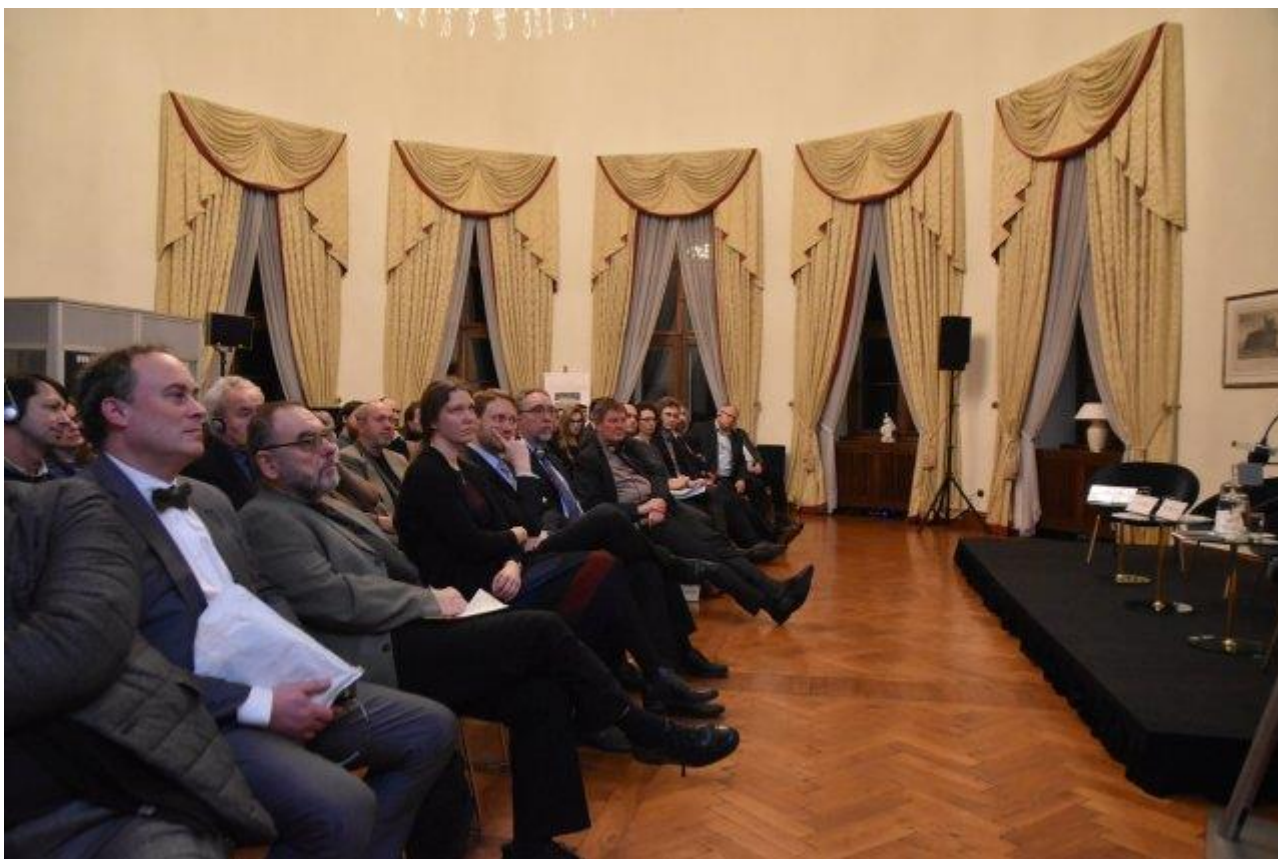
Prezentace knihy na německé ambasádě v Praze (únor 2020)

Kniha je součástí masivního německého pokusu přepsat historii. Přichází v době, kdy umírají poslední pamětníci (narození před rokem 1930). Zesílení lze očekávat zvláště letos, kdy je 75. výročí různých událostí, spojených s koncem II. světové války.